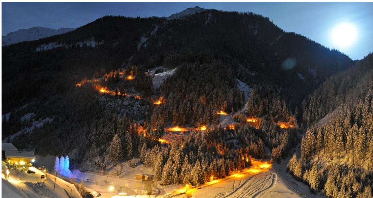
Über 30 Naturrodelbahnen gibt es in Osttirol/Österreich – neun davon, mit insgesamt über 15 Kilometer, sind abends beleuchtet und laden zum stimmungsvollen Nachrodeln ein.

Die Abgeschiedenheit der Täler, die weiten Flächen des Nationalparks Hohe Tauern und die bewahrte Ursprünglichkeit der Landschaft schaffen beste Bedingungen für sportliche Aktivitäten im Sternenlicht. Besonders beliebt ist das Nachtrodeln auf den zahlreichen Naturbahnen der Region. Mit Stirnlampe oder unter Flutlicht sausen sie talwärts, oftmals samt gemütlicher Einkehr im Gasthaus als Auftakt oder Ausklang. So auch am Fuße des Rauchkofels auf der Naturrodelbahn Lienzer Dolomiten in Leisach (1,1 km) mit insgesamt sieben Kehren, auf der Alpe Stalle in St. Jakob (1,8 km) im Defereggental, wo sich ein Abstecher bei Hüttenwirt Bruno auf 1.714 Metern Höhe lohnt oder auf der Strecke Winkeltal/Tilliachalm in Außervillgraten, die sogar mit dem Tiroler Naturrodelbahn Gütesiegel zertifiziert ist. Ein sportlicheres Tempo bietet das Flutlichtskifahren in Kartitsch und Virgen, wo bestens präparierte Pisten ein bzw. zweimal pro Woche bis in die Abendstunden für Schwünge im Scheinwerferlicht geöffnet sind. Ruhiger, aber nicht weniger stimmungsvoll zeigt sich die Fackelwanderung rund um den zugefrorenen Tristacher See: Im warmen Licht der Flamme spiegelt sich der Winterhimmel auf der Eisfläche, während die umliegenden Lärchen und Fichten in der Dunkelheit verschwimmen.