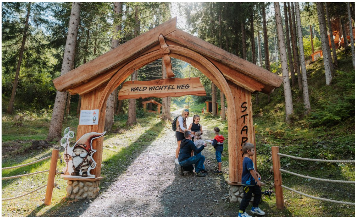
Der neue Waldwichtelweg im Wichtelpark Sillian in Osttirol, Österreich bietet Kindern eine unterhaltsame Möglichkeit, den Wald spielerisch zu entdecken und einen verlorenen Schatz zu finden.

Die Luft im Wald enthält 90 Prozent weniger Staubpartikel als in der Stadt. In Osttirol sind rund 680 Quadratkilometer von dem gesundheitsfördernden Erholungsraum bedeckt. Wer beim Wandern, Biken oder Waldbaden in die Stille eintaucht, findet innere Ruhe und schöpft neue Kraft. Die Wissenschaft ist überzeugt, dass die grüne Umgebung sogar vor Depressionen, psychischer Stressbelastung, Burnout, Herzinfarkt schützt und chronische Schmerzen lindern kann. Ein Spaziergang durch den Oberhauser Zirbenwald im Defereggental, größter zusammenhängender Zirbenbestand der Ostalpen, oder ein Besuch des Natur- und Kulturlehrwegs Debanttal laden dazu ein, die Kraft der Bäume umgeben von 266 Dreitausendern auf sich wirken zu lassen. Mit Attraktionen wie dem neuen Waldwichtelweg im Wichtelpark Sillian wird die Natur zum Abenteuerspielplatz für Groß und Klein. An sieben interaktiven Stationen suchen Familien einen verlorenen Schatz und entdecken die Geheimnisse des Dickichts. Mut, Geschick und Teamgeist sind gefragt, wenn Kinder in Baumkronen klettern, durch Labyrinth streifen oder im „Goldsucher-Stollen“ nach versteckten Münzen graben.